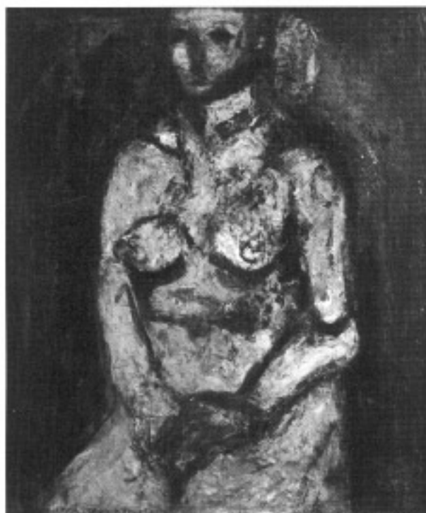
灰色の裸 1953年 京極町蔵